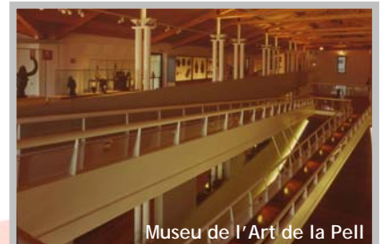
Museu de l'Art de la Pell

Just davant del museu es pot observar part del canal industrial que en total està format per gairebé dos km plens d'història. Construït el 1848 aprofitant l'existència de l'antiga sèquia del Molí de Dalt, el canal alimentava set fàbriques i dos molins, a més de ser el punt de trobada de les dones de famílies obreres, ja que també s'hi ubicaven els rentants .