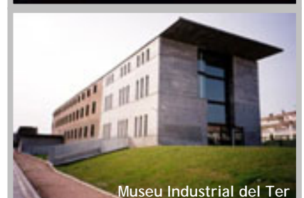
Museu Industrial del Ter