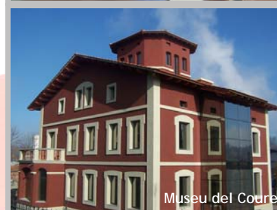
Museu del Coure