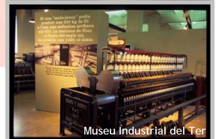
Museu Industrial del Ter