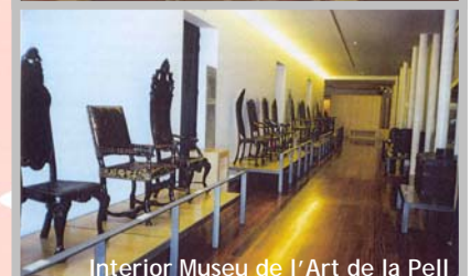
Interior Museu de l'Art de la Pell